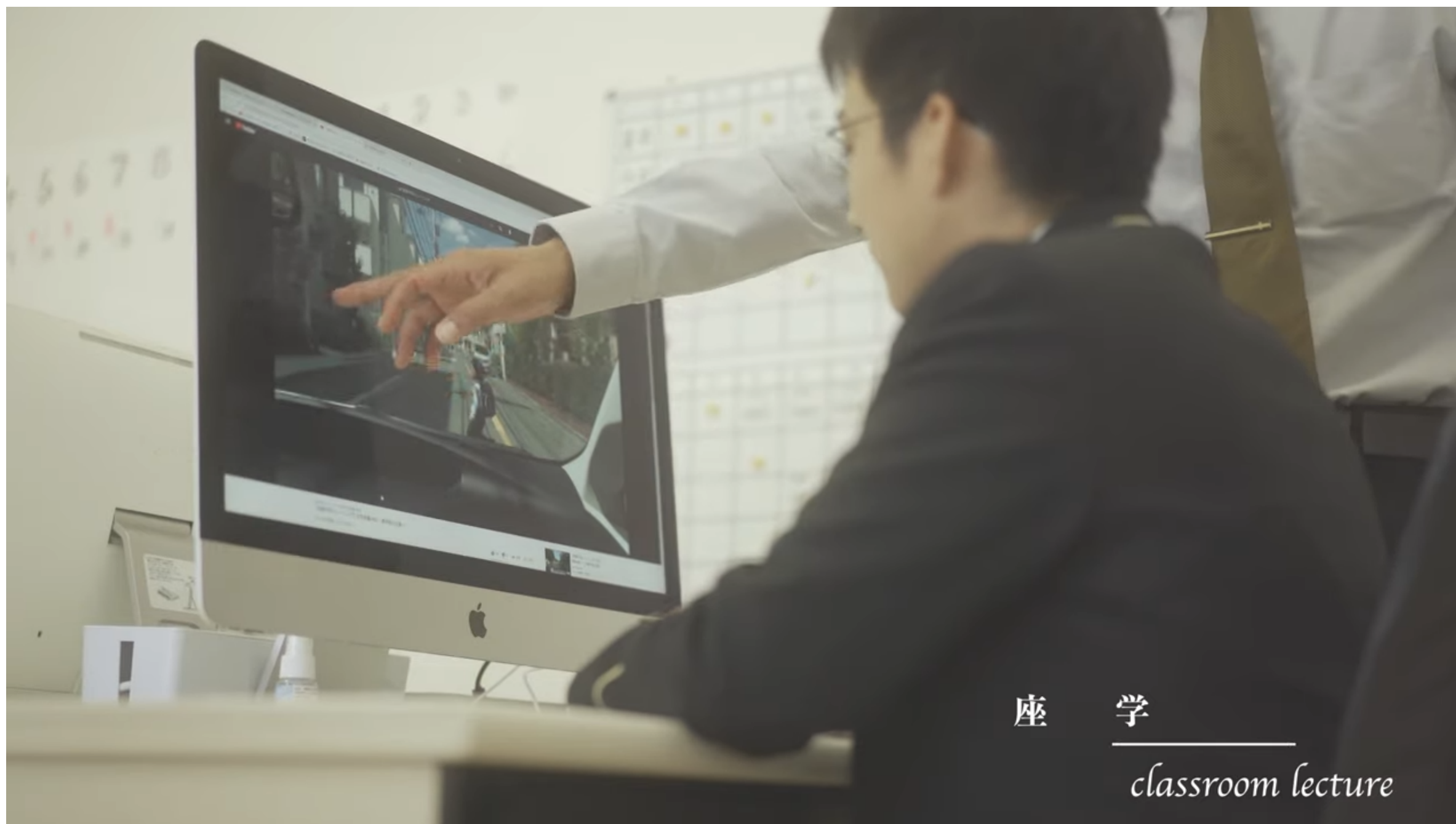
座 学 classroom lecture