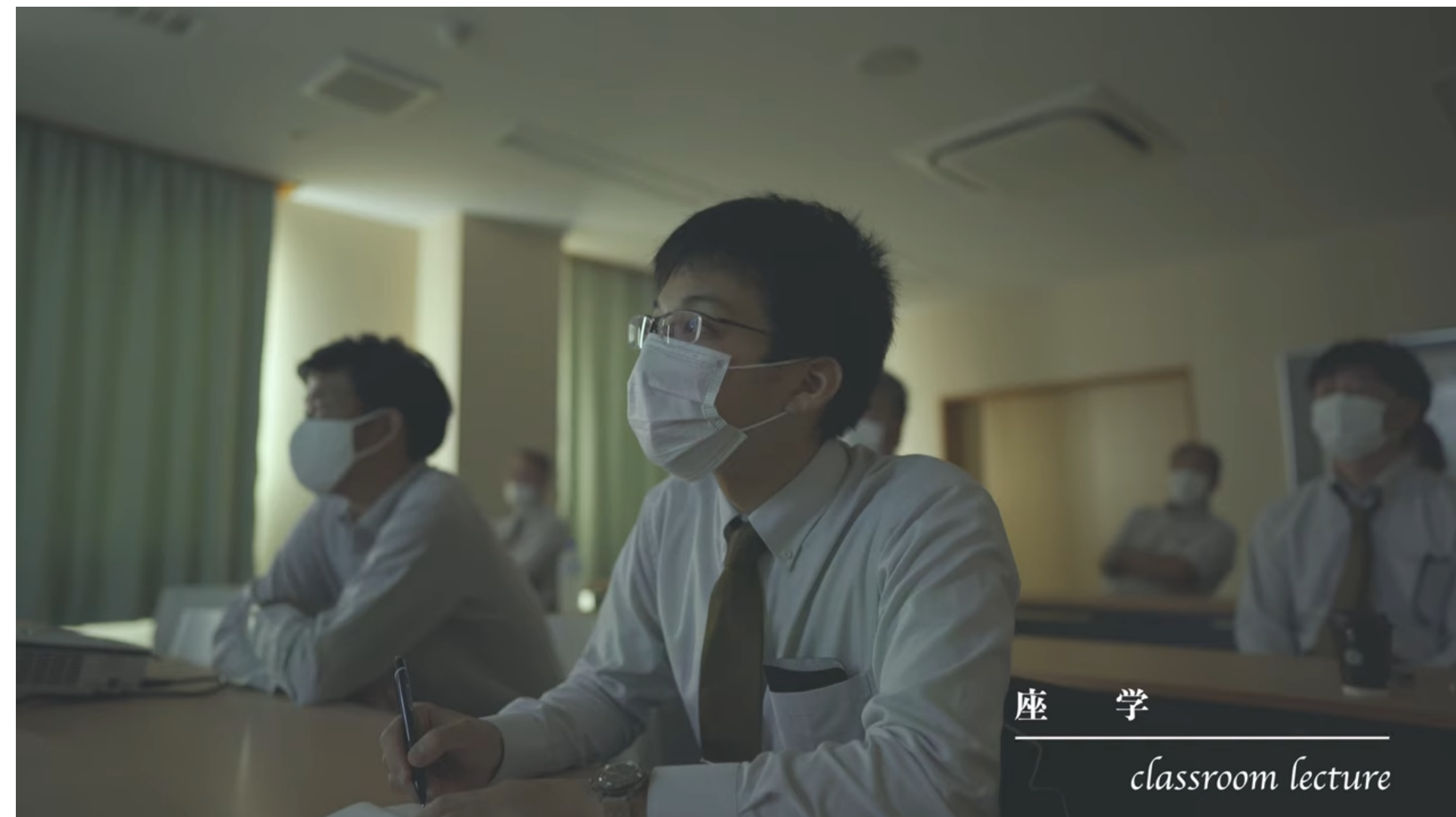
座 学 classroom lecture